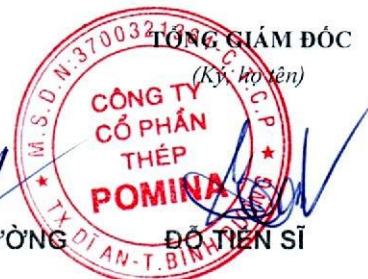
ĐỖ TIẾN SĨ